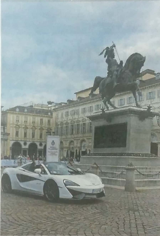
La sfilata Una supercar attraversa piazza San Carlo